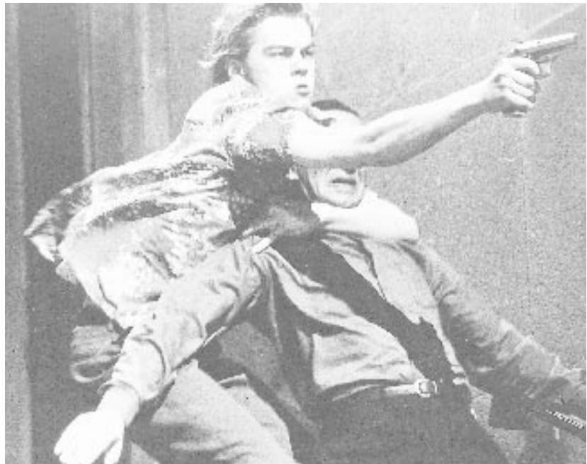
Leonardo DiCaprio i rollen som Romeo. Ung och passionerad i sin kärlek till Julia.

“Two households, both alike in dignity, In fair Verona, where we lay our scene, From ancient grudge break new mutiny,